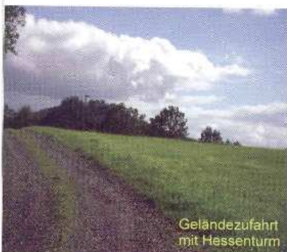
Geländezufahrt mit Hessesturm

Nachdem wir uns eingerichtet hatten, wurde erst einmal Sonne getankt, und die schien reichlich, was nach der Wetterprognose und den Stunden vorher nicht zu erwarten war. Dann war Geländebesichtigung angesagt. Entgegen einer früheren Beschreibung gab es auch einen Stromanschluss, der in 2005 verlegt wurde. Natürlich schaut man sich zuerst die Sozialräume an, es gab nichts zu beanstanden. Der Gag war die warme Dusche, 5 (!) Cent mussten in ein Zählwerk gesteckt werden damit es warmes Wasser gab, es reichte zum abdschen. Eine Möglichkeit zum Geschirrspülen ist natürlich auch vorhanden, das warme Wasser dafür ist frei. Dazu noch ein Lob an alle FKKler, was man auf den meis-